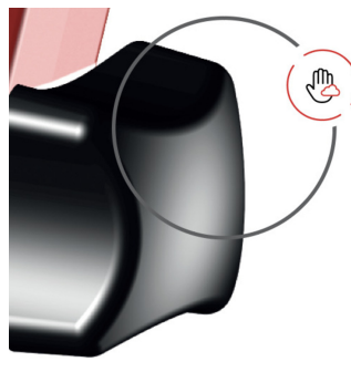
extra reduced radius spin