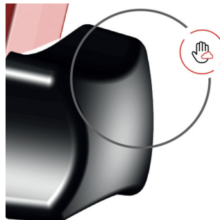
zusätzlich reduzierter Wenderadius