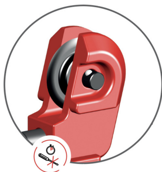
Changement de roue instantané