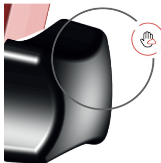
extra reduced radius spin