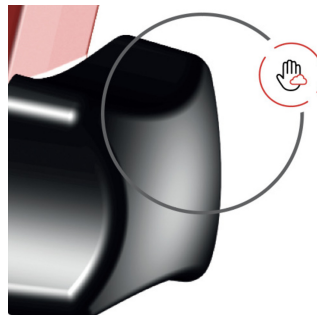
zusätzlich reduzierter Wenderadius