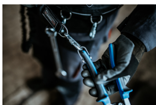
Figura tregon lidhjen e saktë të mjetit në mbërthyes. Vareni mjetin në rrip, duke ndjekur hapat në rend të kundërt.

Hapni karabinanë në rrip dhe hiqni mjetin nga karabina. Mjeti tani është gati për t'u përdorur.