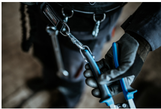
Figura tregon lidhjen e saktë të mjetit në mbërthyes. Vareni mjetin në rrip, duke ndjekur hapat në rend të kundërt.

Hapni karabinanë në rrip dhe hiqni mjetin nga karabina. Mjeti tani është gati për t'u përdorur.