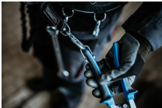
Figura tregon lidhjen e saktë të mjetit në mbërthyes. Vareni mjetin në rrip, duke ndjekur hapat në rend të kundërt.

Hapni karabinanë në rrip dhe hiqni mjetin nga karabina. Mjeti tani është gati për t'u përdorur.