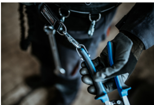
Figura tregon lidhjen e saktë të mjetit në mbërthyes. Vareni mjetin në rrip, duke ndjekur hapat në rend të kundërt.

Hapni karabinanë në rrip dhe hiqni mjetin nga karabina. Mjeti tani është gati për t'u përdorur.