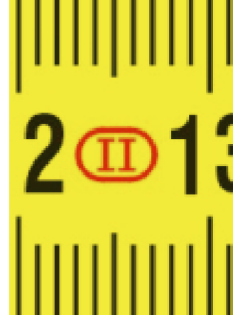
Preciseness to class II