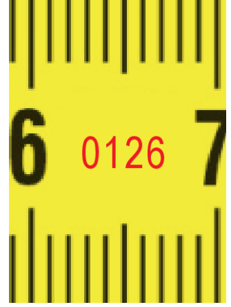
Onaylanmıř kuruluş no.