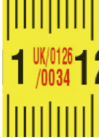
Avrupa tipi onay sertifikası