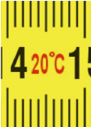
Çalıřma sıcaklıđı durumu