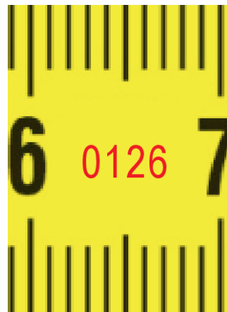
Notifikovaný orgán č.