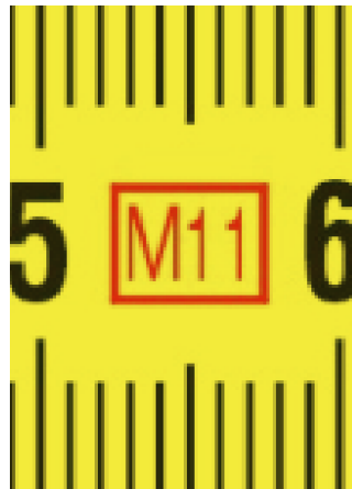
An de fabricatie