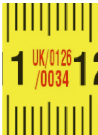
Европски сертификат за одобрување на тип