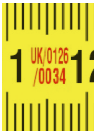
Европски сертификат за одобрување на тип