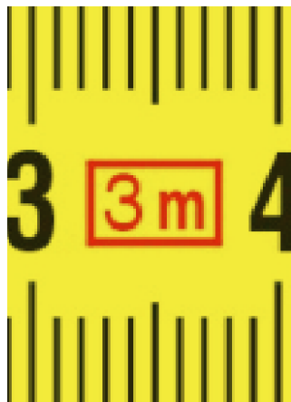
Должина на лента