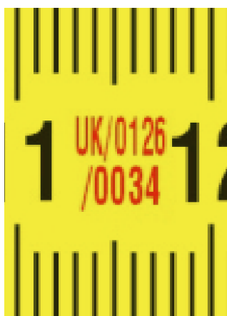
Certificato di approvazione europeo