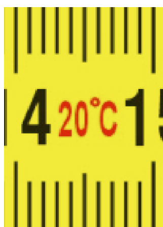
Condizione della temperatura di lavoro