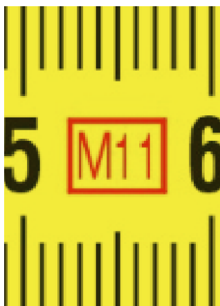
Anno di produzione