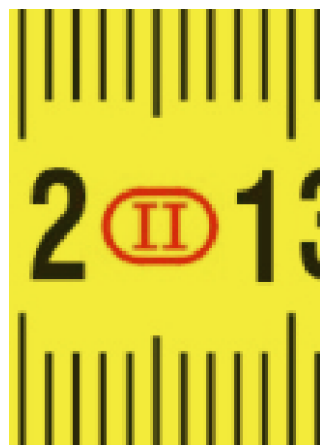
Precisenness to class II