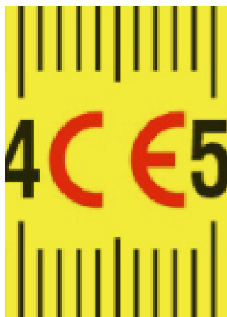
Izrađeno u skladu s harmoniziranim standardima