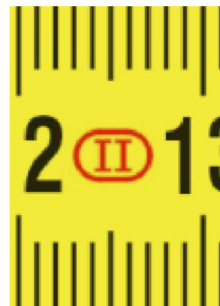
Precisenness to class II