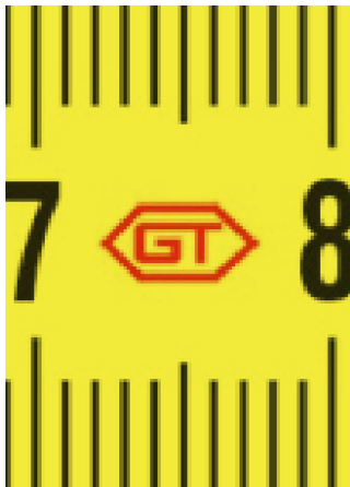
Abreviaturas de fabricante