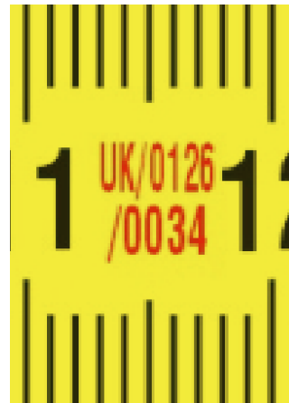
Certificado de homologación de tipo europeo.