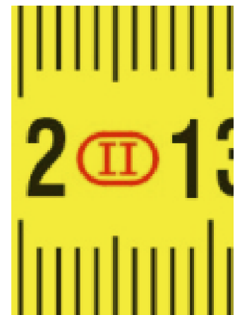
Precisenness to class II