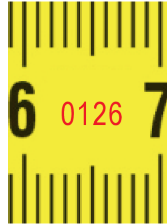
Prijavljeno tijelo br.