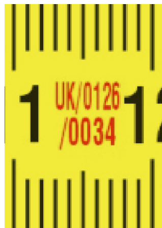
Evropski certifikat o odobrenju tipa