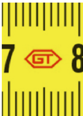
Абревиатура на производителя