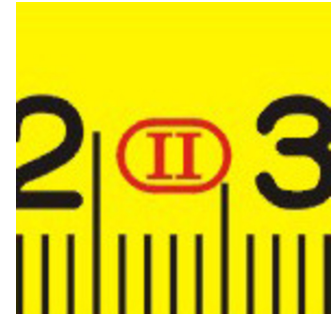
Preciseness to class II