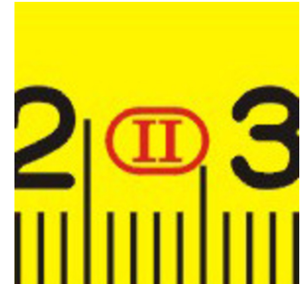
Precisenness to class II