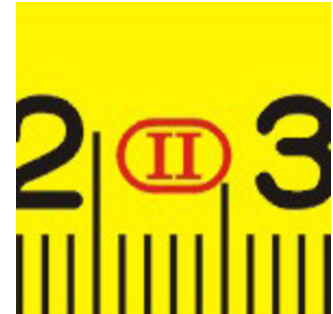
Klasa natančnosti II