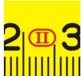
Klasa natančnosti II