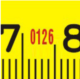
Notifikovaný orgán č.