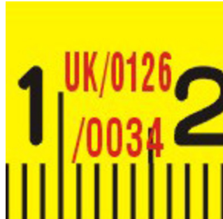
Európske osvedčenie o typovom schválení