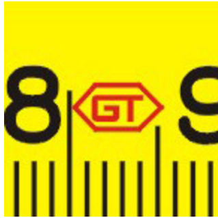
Abbreviations for manufacturer