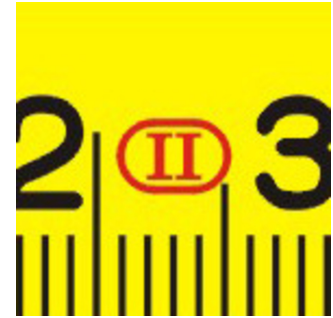
Preciseness to class II