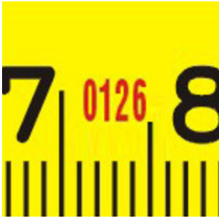
Odnutowany numer korpusu.