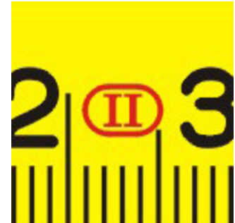
Preciseness to class II