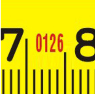
Notified body no.