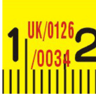
European type approval certificate