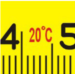
Condizione della temperatura di lavoro