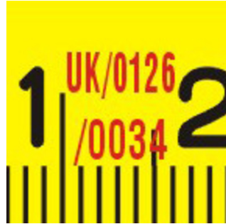
Certificato di approvazione europeo