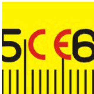
Izrađeno u skladu s harmoniziranim standardima