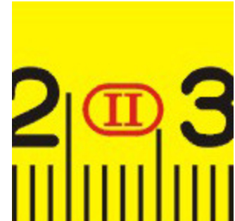
Precisenness to class II