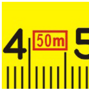
Longitud de la cinta