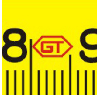
Abreviaturas del fabricante