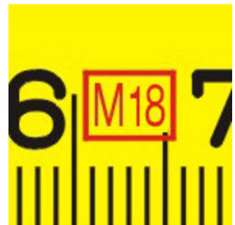
Año de fabricación