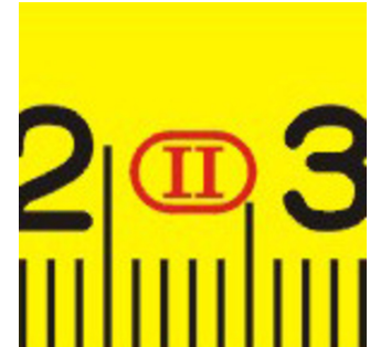
Přesnost do třídy II