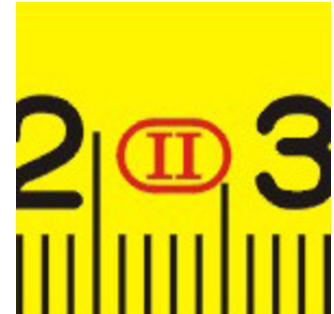
Přesnost do třídy II