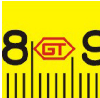
Abbreviations for manufacturer