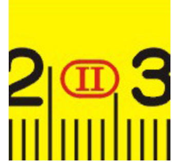
Preciseness to class II