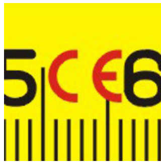
按照统一标准制造