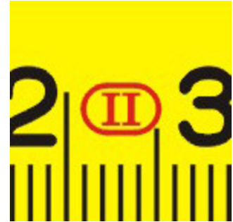
Precisenness to class II