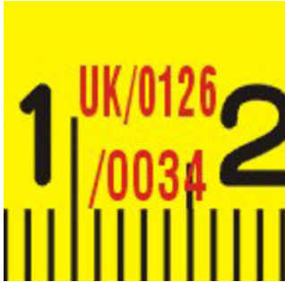
Evropski certifikat o odobrenju tipa