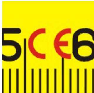
Proizvedeno u skladu sa usklađenim standardima