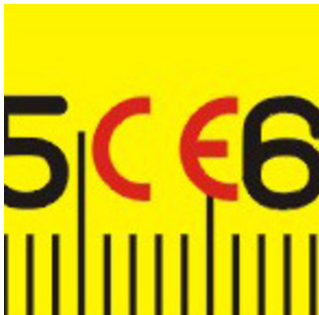
Hergestellt gemäß harmonisierter Standards